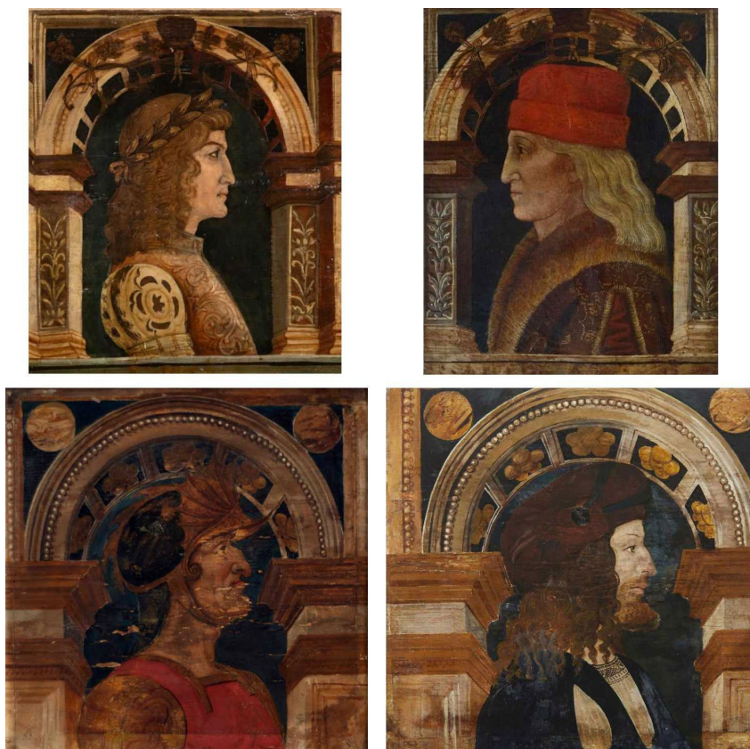
Fig. 3 - Botteghe bresciane, Busti maschili entro arcate prospettive cassettonate , ultimo quarto del XV secolo, collezioni private. [immagini tratte dai seguenti cataloghi d'asta, in alto a sinistra: Old master & 19th century paintings 2023 , vendita all'asta (Wannenes, 20 gennaio-1° febbraio 2023); in alto a destra: Antiquariato, autori del XIX e XX sec., arte moderna e contemporanea 2023 , vendita all'asta (Firenze, Galleria Pananti, 22 giugno 2023); in basso: Arte antica e del XIX secolo 2022b , vendita all'asta (Brescia, Capitolium Art, 13-14 dicembre 2022)].

A questi insiemi può essere avvicinato anche il solaio di un altro palazzo bresciano oggi noto come Brognoli-Bonera (ed. Begni Redona 1977). L'edificio, costruito attorno al 1470, è la risultanza di una serie di interventi architettonici effettuati in epoche successive; l'apparato decorativo rinascimentale conserva a tratti l'eco degli antichi committenti. Tra i soggetti raffigurati nella galleria di volti maschili e femminili, abbigliati alla moda tardo quattrocentesca, spiccano alcuni personaggi le cui sembianze richiamano «il tipo marcatamente semitico di alcune delle teste» [Fig. 4] proprio come Terni de Gregory e Zeri definirono i tratti e il particolare abbigliamento di alcuni busti sanmartinesi: iconografia peraltro presente anche in un manufatto della serie radunata attorno al profilo femminile di Baltimora.