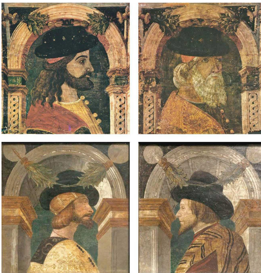
Fig. 4 - Botteghe bresciane, Busti maschili entro arcate prospettiche cassettonate . In alto: 1470 circa, Brescia, palazzo Brognoli-Bonera; in basso: entro il 1491, Londra, Victoria and Albert Museum.

L'arcata prospettica che inquadra i volti nei manufatti di palazzo Brognoli-Bonera mostra i pilastri laterali decorati con il medesimo motivo dei pannelli di palazzo Calzaveglia che si ritrova anche in dodici tavolette oggi nei depositi del Museo Nazionale del Palazzo di Venezia a Roma. Come quasi sempre accade, anche per quest'ultimo insieme, recentemente attribuito ad ambito mantovano ma con ogni evidenza bresciano, sono ignoti il contesto di provenienza e le vicende relative allo smontaggio; le uniche informazioni utili rinviano al pittore spagnolo José Gallegos y Arnosa, a Roma dal 1880, che aveva acquisito i manufatti per la sua collezione; acquistati dalla Galleria d'Arte Antica di Palazzo Corsini, furono trasferiti a Palazzo Venezia nel 1919 quando Federico Hermanin ne curò il riallestimento.