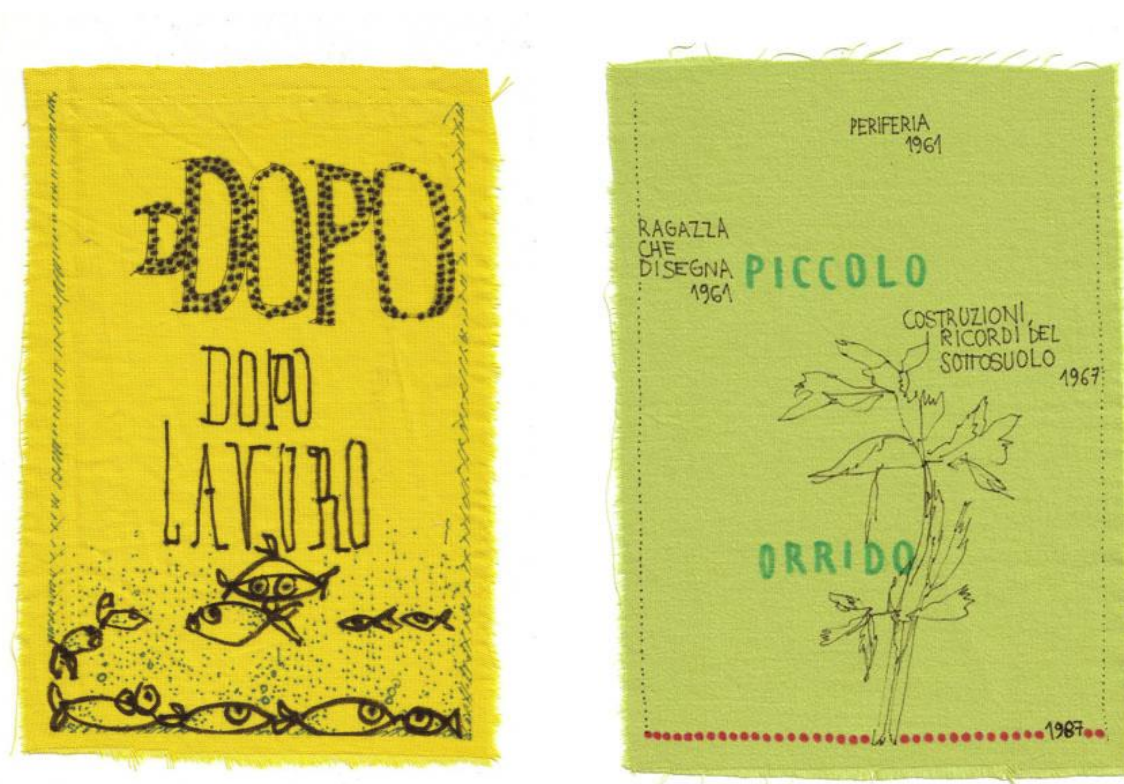
Fig. 6: Eva Marisaldi, Dopolavoro , disegni su tessuto, 2013, dettaglio. Courtesy: l’artista e Galleria del Premio Suzzara.

L’impressione è quella di un linguaggio e una figurazione al suo interno coerente che siamo chiamati a decifrare; un vero e proprio alfabeto, geroglifici di cui riusciamo a cogliere e comprendere alcuni frammenti, senza raggiungere mai – lo capiamo subito - una consapevolezza completa, appagante, tranquillizzante [fig. 6].