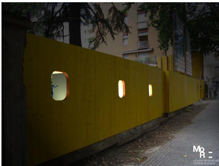
Fig. 8: Eva Marisaldi, Promise - Progetto per la recinzione del cantiere del Museion di Bolzano , rendering, 2007. Courtesy: l'artista e MoRE. Museum of refused and unrealised art projects ( www.moremuseum.org ).

Anche attraverso operazioni come questa del resto, Marisaldi riconosce il valore dell'istituzione e della collezione tanto da parlare di una visita al museo come di una promessa Promise - Progetto per la recinzione del cantiere del Museion di Bolzano [2007] in un'opera non realizzata (ed. Modena 2013). Fin dal titolo, questo progetto di installazione allude infatti ad un'esperienza unica, un'attesa cadenzata da una serie di statuette in resina poste in dodici teche a forma di oblò da inserire nel perimetro della staccionata di recinzione del museo allora in costruzione, in cui una hostess avrebbe presentato dodici movimenti del "pre flight briefing", praticato dalle assistenti di volo prima del decollo di un aereo [fig. 8].