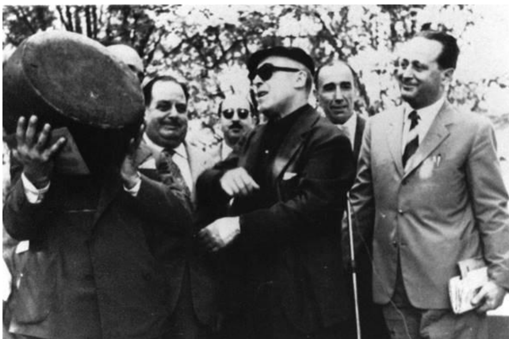
Fig. 2: Cesare Zavattini consegna una forma di formaggio, VII edizione del Premio Suzzara, 1954.

Oltre alla formula del Premio, molto diffusa nel dopoguerra, e dei premi-baratto con prodotti locali (con tanto di slogan: «Un vitello per un quadro, non abbassa il quadro: innalza il vitello»), anche la scelta del tema appare funzionale alla richiesta di normalità emersa alla fine della seconda guerra mondiale [fig. 2].