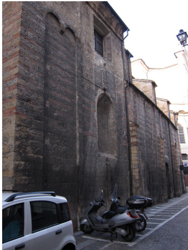
Fig. 6: Parma, Sant'Andrea, prospetto settentrionale, vista verso ovest.