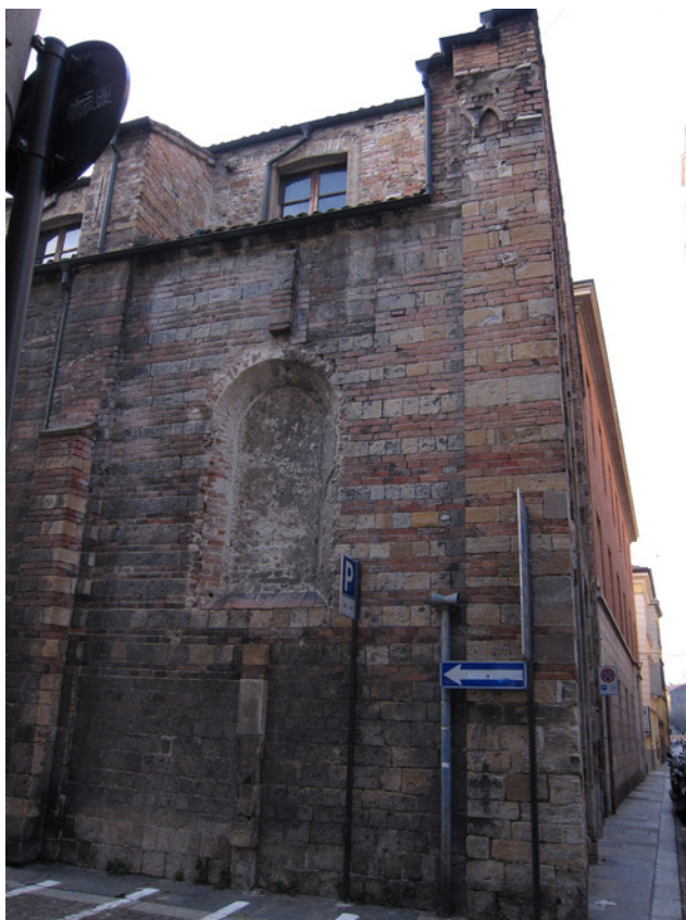
Fig. 5: Parma, Sant'Andrea, perimetrale settentrionale, prima campata occidentale.