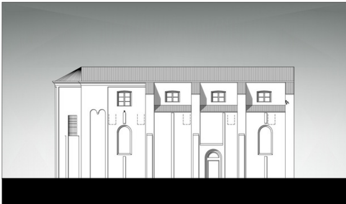
Fig. 4: Restituzione grafica del prospetto settentrionale di Sant'Andrea (disegno Erica Bossi).

raggiunge una quota pari a quella del cleristorio [fig. 4]. Il perimetrale settentrionale è scandito da contrafforti in quattro specchiature, ciascuna a sua volta bipartita da una lesena, ad esclusione dell'estrema specchiatura orientale che ne presenta due; in corrispondenza della seconda campata si apriva un portale, ora tamponato.