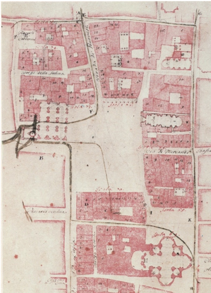
Fig. 9: Parma, Archivio Storico Comunale, UP 9, Atlante Sardi, 1767, tav. XIII (per gentile concessione dell' Archivio Storico Comunale, prot. PG/2011/58272 - 2011.I/6.21/1, e dell'Archivio di Stato di Parma, prot. 930/V.9.3).

Le analisi che sono state proposte, le ipotesi di inquadramento cronologico delle architetture, le ricostruzioni di assi viari e degli spostamenti dei confini della città, purtroppo celano problematiche a cui non è facile rispondere. Se, come gli studi sopra menzionati hanno messo in luce, la creazione della platea e la sua monumentalizzazione possono essere correlati alla forte volontà da parte del Comune di una serrata organizzazione urbanistica nel corso del XIII secolo, resta ancora problematico stabilire se la vigorosa crescita urbana della seconda metà del