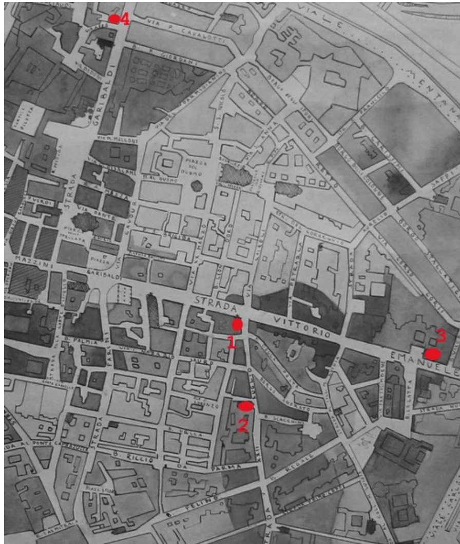
Fig. 1: Parma, Archivio Storico Diocesano Vescovile, Parma, pianta della città e del territorio (disegno di Merusi R., scala 1:10000, 1932). 1. Santa Cristina, 2. San Quintino, 3. Santo Sepolcro, 4. San Barnaba.

La chiesa, dunque, nella seconda metà del XII secolo, si trova appena al di fuori delle fosse che delimitano la città (Conforti 1979, p. 43), mentre in epoche successive verrà cinta da mura e darà il nome ad una porta e ad un bastione (Capelli 1971, p. 34): la chiesa esiste tuttora, sede di un esercizio commerciale, in via Affò, in un contesto urbanistico fortemente modificato nel corso della seconda metà del XX secolo (Capelli 1971, p. 35) e pur trasformata nella destinazione d'uso e ritessuta da alcuni restauri, risulta abbastanza leggibile nella facciata e nel fianco meridionale, uniche parti ancora esistenti della struttura originaria; in particolare il fianco, scandito da lesene in sette specchiature, mostra tre monofore di cui si intravedono le tracce in una fotografia antecedente i restauri (Capelli 1971, fig. p. 33), mentre l'originaria articolazione parietale è restituibile attraverso i disegni di Alessandro Sanseverini, che attestano la presenza di un'ottava specchiatura e di un fregio ad archetti pensili