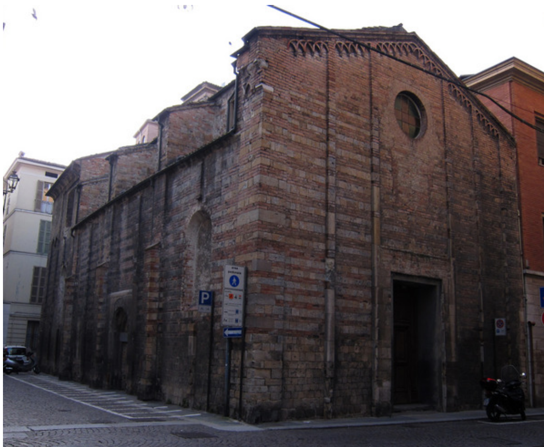
Fig. 3: Parma, Sant'Andrea, facciata e prospetto settentrionale.

Parma (Calzona 1989), e se il ciclo parmense è stato realizzato tra 1250 e 1254 (Gavazzoli Tomea 2007), risulta plausibile l'ipotesi già avanzata da Gianfranco Fiaccadori (1986) che l'artefice sia stato attivo a Parma prima di spostarsi a Mantova: verosimilmente dunque proprio il vescovo Martino può avere costituito il trait d'union tra le due città.