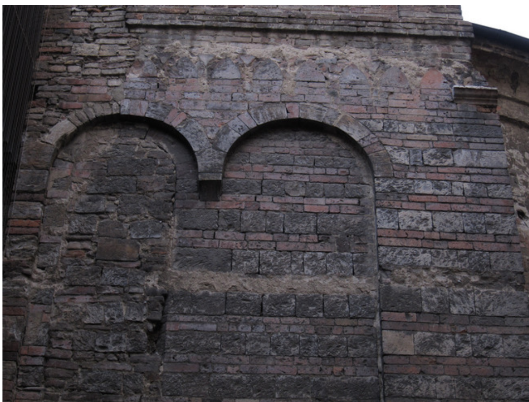
Fig. 7: Parma, Sant'Andrea, perimetrale meridionale, particolare.

occidentali, mentre è possibile individuarne l'originaria, parziale articolazione ad est, ove l'estrema specchiatura verso l'abside è sovrastata da due archetti pensili [cfr fig. 6]. Considerando la non uniformità delle specchiature, è possibile supporre che fossero chiuse da un numero variabile di archetti pensili, plausibilmente tra i due e i quattro, ad esclusione della terza, sovrastata da un solo archetto, fortemente contratta a causa della presenza del portale laterale nella medesima campata. Le monofore, ora tamponate ma ancora riconoscibili nei loro profili, si aprivano nella prima, terza, quinta, settima e ottava specchiatura, in posizione decentrata e adesa alla lesena, a ridosso del sistema degli archetti.