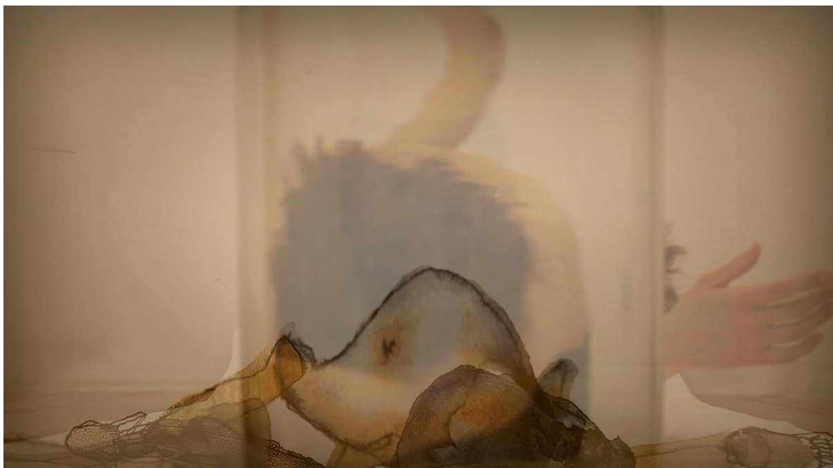
Fig. 1: Rusciano F 2013, Liquid Path , 2013, still, © Rinedda.

gesti-tocchi-pensieri, la figura sembra quasi coreografare la voce liquida e corporea di Hélène Cixous, arconte privilegiata di questo matri-archivio, che ha forgiato la parola-gesto «TogetherOtherness» per descrivere l'evento che accade nell'atto della scrittura: un atto-gesto che è già «alterità»; essa implica una con-divisione, una con-partizione e, simultaneamente, comprende in sé un «insieme» per essere esperita o messa in opera (Cixous 2010).