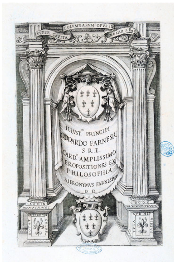
Fig. 1: Incisore anonimo del XVII secolo, bulino e acquaforte, f. 336x230 mm, m. 240x155 mm. Frontespizio di Gerolamo Farnese, 1617. Roma, Biblioteca Nazionale Centrale, 14. 8. G. 10.

estrazione di età compresa tra i dieci e i vent'anni, provenienti da città italiane e straniere. Oltre alle discipline teoriche tradizionali – grammatica, retorica, umanità, filosofia, teologia, matematica e legge – venivano impartite agli studenti lezioni che li preparassero ad inserirsi nella società nella quale sarebbero presto stati introdotti, ossia scherma, equitazione, ballo, musica, lingua francese e tedesca. A questa istituzione Ranuccio ne aggiunse un'altra nel 1603, il Collegio dei Nobili convittori legisti, una sezione distinta, a metà tra l'istruzione secondaria e quella superiore, nella quale gli studenti rimanevano fino al compimento degli studi universitari (Capasso 1901; Salomone (ed.) 1979; Brizzi 1980; Bolondi 1987; Di Noto Marrella 1997; Del Monaco 1995; Turrini 2006; Dallasta 2010, pp. 150-151, 205-211; Mora (ed.) in corso di pubblicazione).