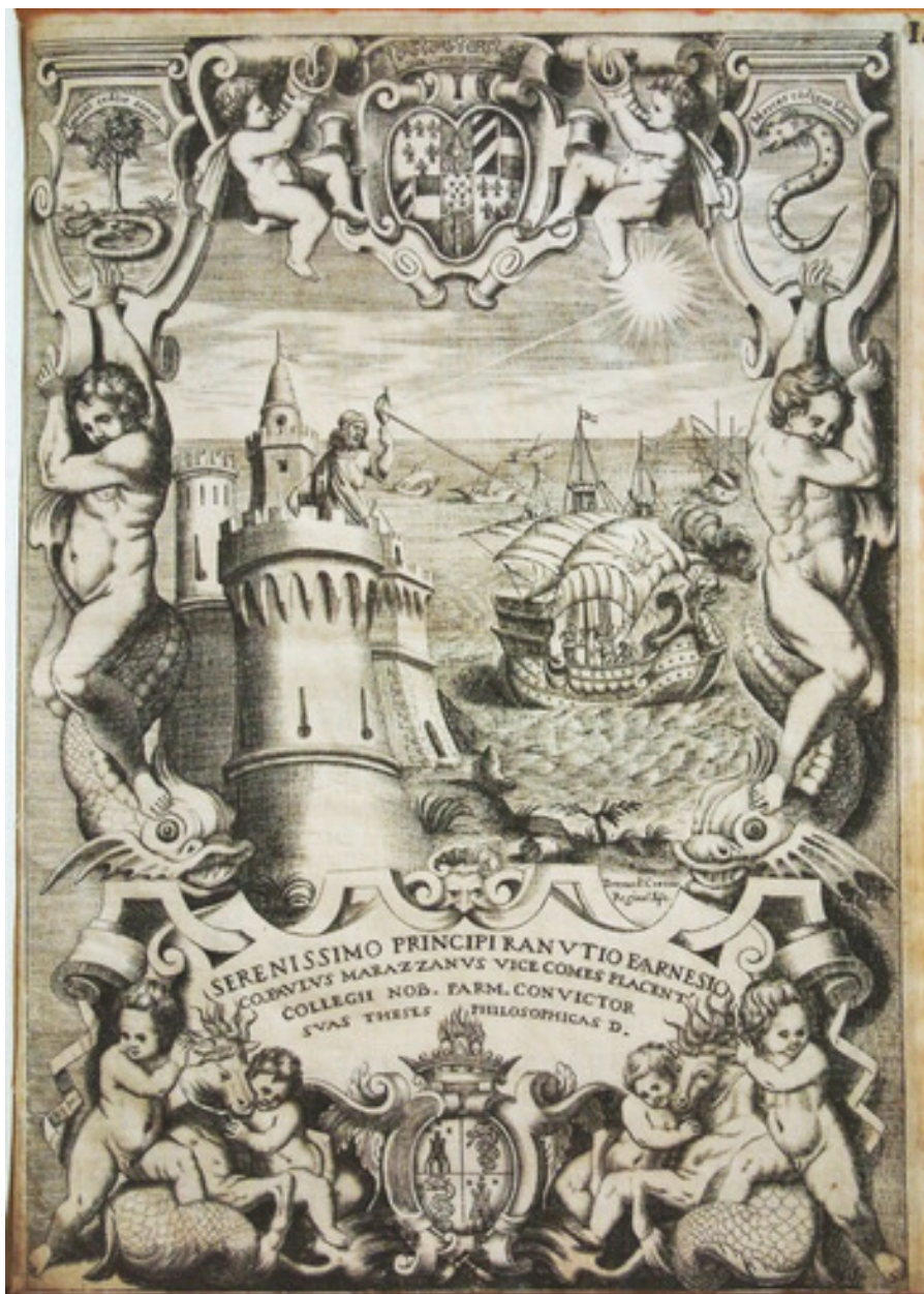
Fig. 7: Bernardino Curti, bulino e acquaforte, f. 278x193 mm, m. 274x191 mm. Antiporta di Paolo Marazzani, 1645. Piacenza, Biblioteca Passerini Landi, Lasc. Pall. 3/1.

Il tema del superamento della parte ferina della natura umana grazie alla ragione ed alla conoscenza è ripreso nell'antiporta del volume delle tesi filosofiche di Paolo Marazzani, pubblicato a Parma per i tipi di Mario Vigna nel 1645 (Travisonni 2010, pp. 118-119) [fig. 7].