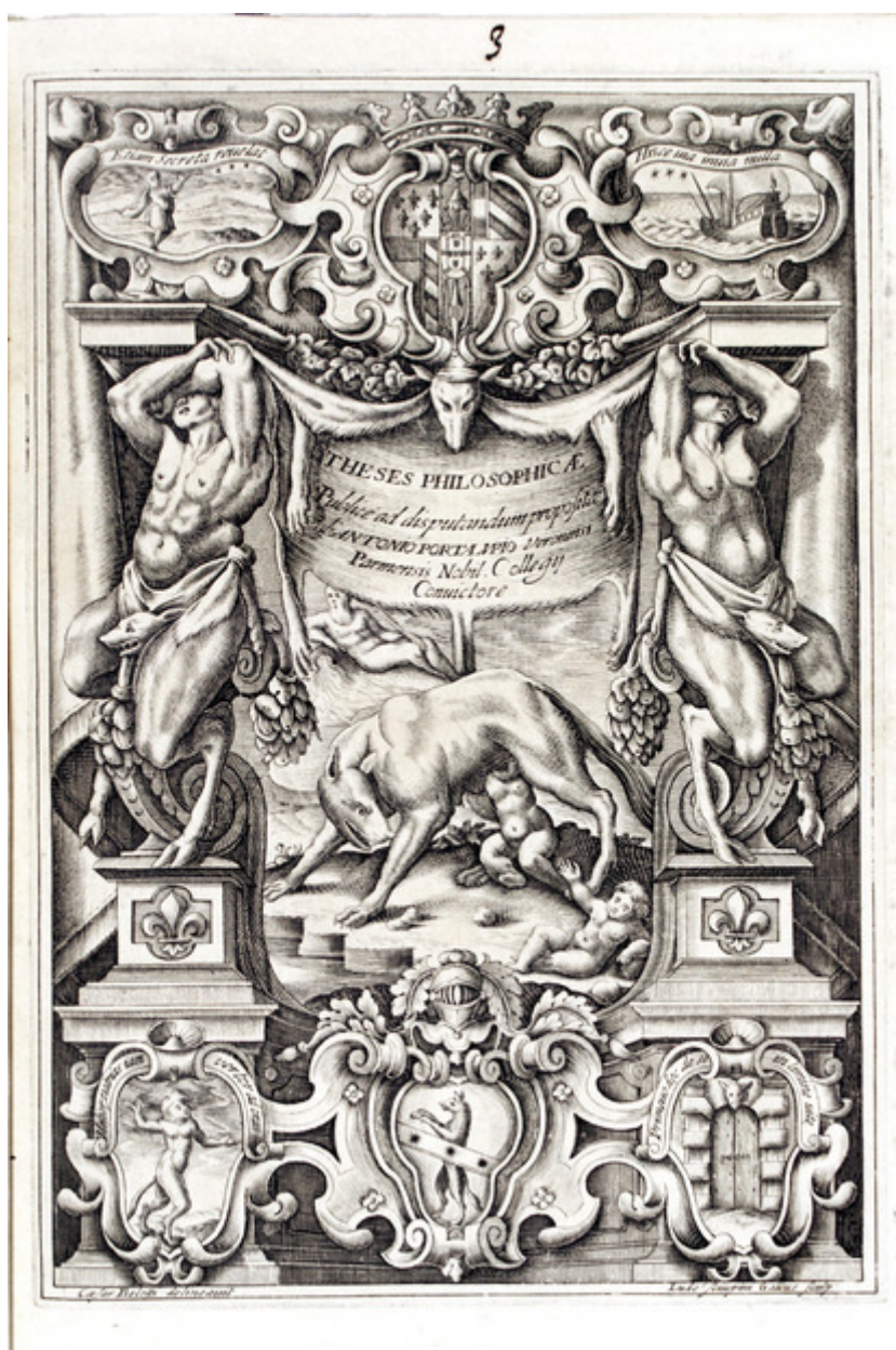
Fig. 6: Louis Chupin, Marco Cesare Bellotti, bulino f. 28x195 mm, m. 233x163 mm. Frontespizio di Antonio Portalupi, 1638. Roma, Biblioteca Casanatense, Vol. Misc. 1557/3.

L'idea del superamento della ferinitas e del raggiungimento dell' humanitas grazie agli studi condotti a Parma è ripresa nel frontespizio - disegnato da Cesare Bellotti e inciso da Louis Chupin - delle tesi pubblicate a Parma nel 1638 per il veronese Antonio Portalupi (Travisonni 2010, pp. 117-118), nel quale il messaggio gioca anche con l'etimologia del nome del giovane [fig. 6].