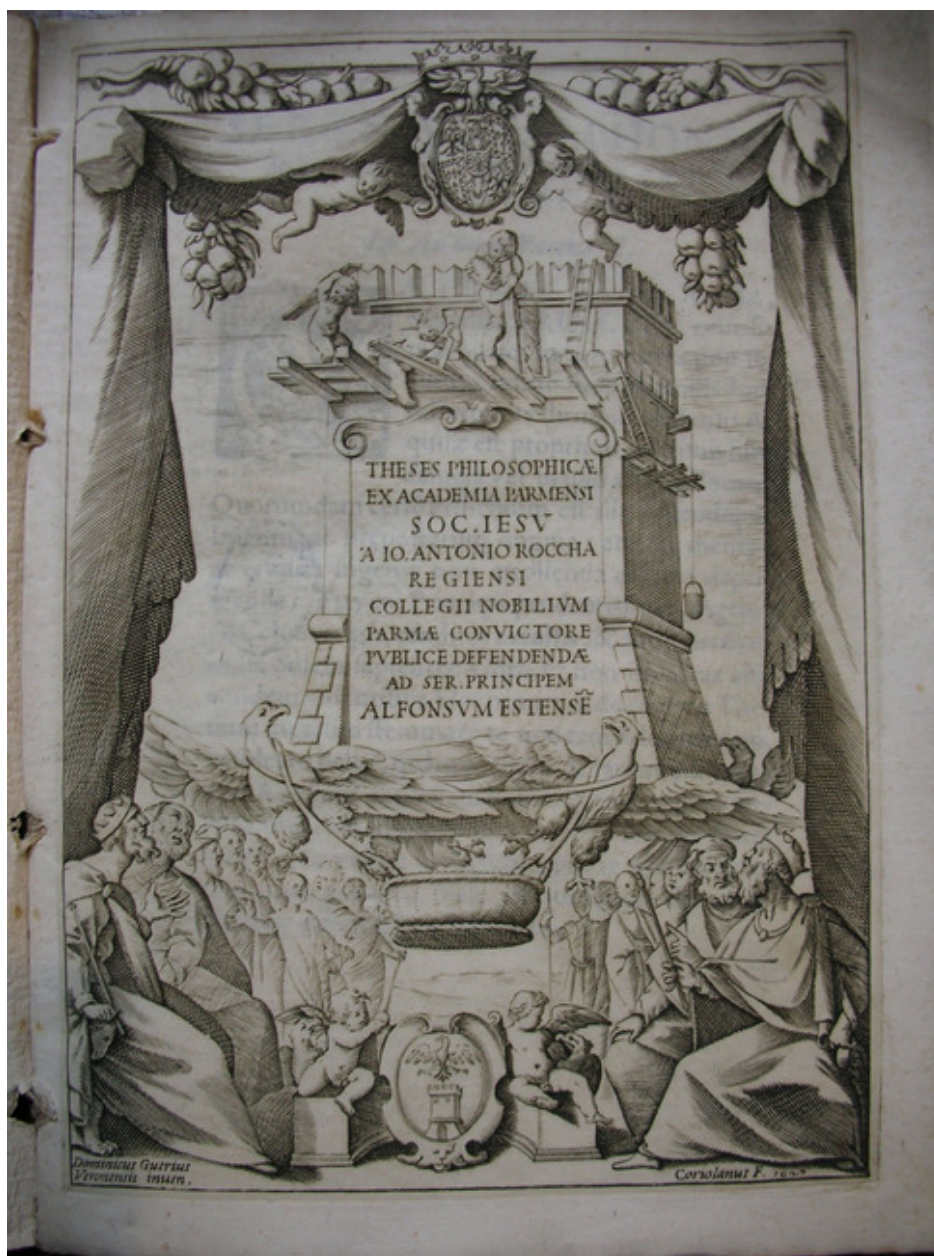
Fig. 5: Giovanni Battista Coriolano, Domenico Guerra, bulino, f. 266x194 mm, m. 245x169 mm. Frontespizio di Giovanni Antonio Rocca, 1627. Bologna, Biblioteca dell'Archiginnasio, 32 E 29.

Tutto incentrato sull'elogio del duca Alfonso d'Este e costruito col linguaggio dell'emblematica è il frontespizio inciso nel 1627 per Giovanni Antonio Rocca da Cristoforo Coriolano su disegno di Domenico Guerra (Travisonni 2010, pp. 111-112). La scena, nel più vivo spirito barocco, si apre dietro a un sipario, oltre il quale una rocca, emblema dell'autore, ma anche simbolo, come chiarisce la dedica che introduce il testo, della "rocca della cultura", è sollevata da quattro aquile, chiaro rimando araldico al duca Alfonso d'Este, cui l'opera è dedicata [fig. 5].