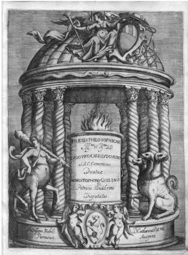
Fig. 3: Incisore anonimo del XVII secolo, acquaforte, f. 235x174 mm, m. 230x172 mm. Frontespizio di Cristoforo Antonio Maria Ghilini, 1622. Alessandria, Biblioteca Civica, IV.24.E.9.