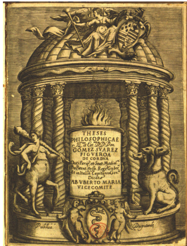
Fig. 4: Incisore anonimo del XVII secolo, acquaforte, f. 235x174 mm, m. 230x172 mm. Frontespizio di Umberto Maria Visconti, 1622. Milano, Biblioteca Braidense, B XIV 5731.