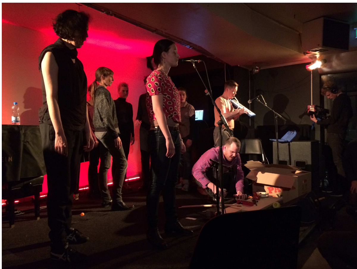
Fig. 1: l'immagine mostra la performance di Jonathan Bepler realizzata con i partecipanti del simposio presso il Salon des Amateurs per il Festival Approximation.

La performance 9 e la sua fase preparatoria hanno chiamato in causa un argomento attuale nell'ambito delle pratiche espositive e delle arti sceniche contemporanee ovvero il mantenimento della possibilità di distinguere la pratica amatoriale da quella professionale. Come evidenza Claire Bishop nei suoi studi, molti sono gli artisti che deliberatamente scelgono di assegnare lo svolgimento delle proprie performance a praticanti amatoriali.