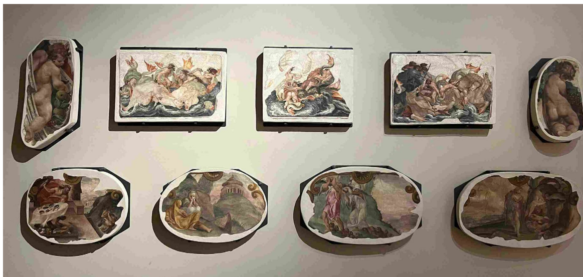
Fig. 4: Lelio Orsi, Nove frammenti con soggetti tratti dalle Metamorfosi di Ovidio, 1555-1556 circa, Modena, Galleria Estense.