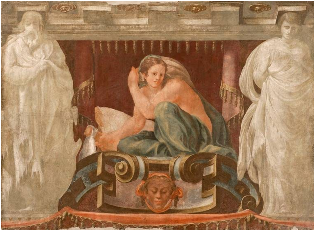
Fig. 3: Lelio Orsi, Allegoria dell'Agricoltura , 1558, Novellara, Museo Gonzaga.