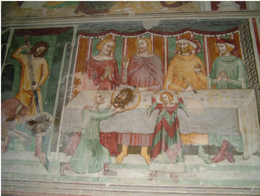
Fig. 24: Terzo Maestro di Sant'Antonio in Polesine, Decollazione del Battista e Banchetto di Erode , Ferrara, Sant'Antonio in Polesine.