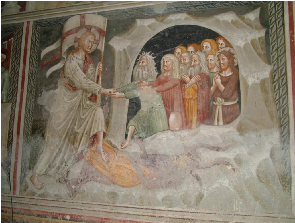
Fig. 25: Terzo Maestro di Sant'Antonio in Polesine, Discesa agli Inferi , Ferrara, Sant'Antonio in Polesine.