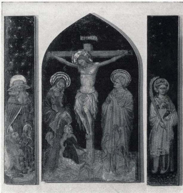
Antonio Alberti da Ferrara: Crocifissione (affresco staccato)