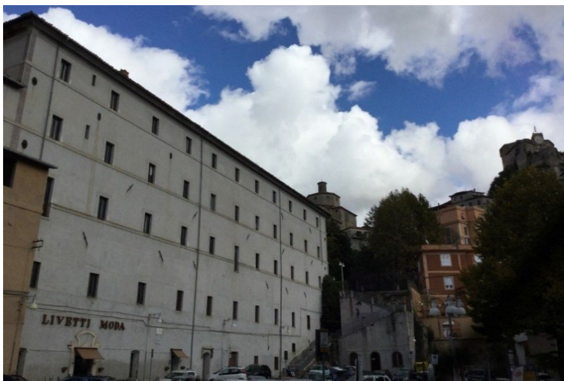
Fig. 4: Subiaco, piazza Ulderico Pelliccia con la Casa della Missione a sinistra e la Rocca Abbaziale in alto a destra.

L'ordine di distribuzione aveva quindi il fine di limitare il diffuso pauperismo e gli atti illeciti connessi, nel limite di una somma non indifferente di più di 100.000 scudi – inclusa una quadreria romana di almeno 348 pezzi – da cui decurtare 20.000 scudi secondo le “Disposizioni a favore di Propaganda Fide e della Congregazione della Divina Pietà di Roma” in favore di queste due istituzioni, oltre ai 7.872 scudi e 90 baiocchi per terminare la Casa della Missione, chiamata “fabbrica di Subiaco”, facendola arredare con i mobili necessari con altri 2.100 scudi [Fig. 4].