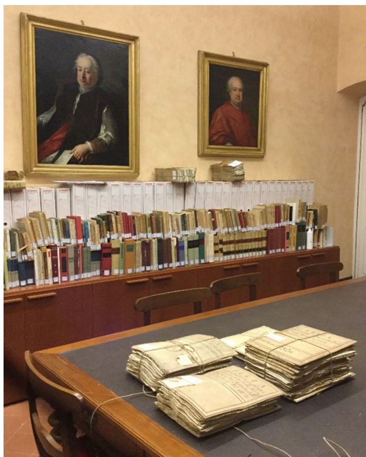
Fig. 3 Sala studio con filze e ritratti del cardinale Spinola, Genova, Fondazione del Magistrato di Misericordia (archivio dell'autore).