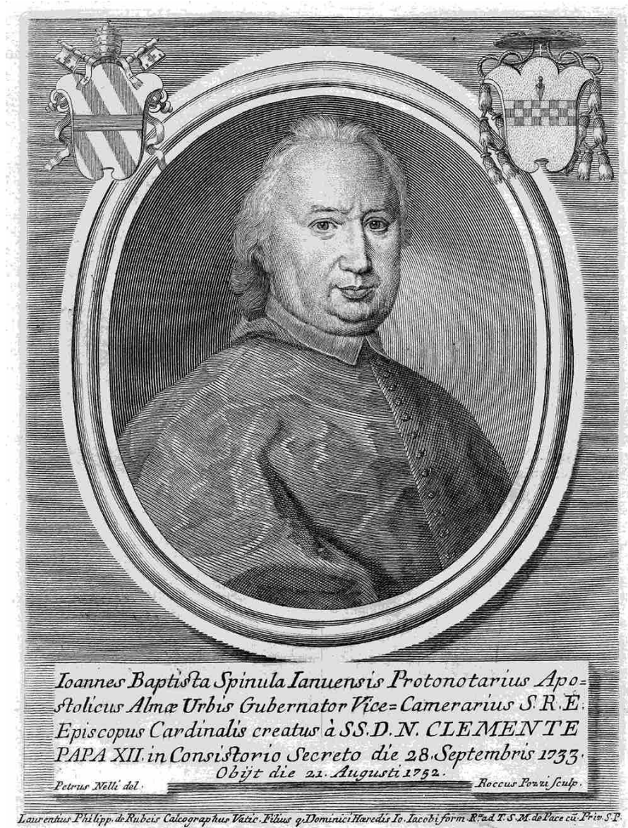
Fig. 1: Rocco Pozzi, Ritratto di Giovanni Battista Spinola , incisione, su concessione del Ministero della Cultura, Istituto Centrale della Grafica, Roma, inv. CL 2352.

coppia avrebbe potuto servirsi per un baiocco al giorno, probabilmente ben oltre la somma inizialmente prevista di 254 baiocchi, se il porporato non fosse scomparso nell'agosto 1752 (AMM, Filze Actorum , 909, doc. 218).