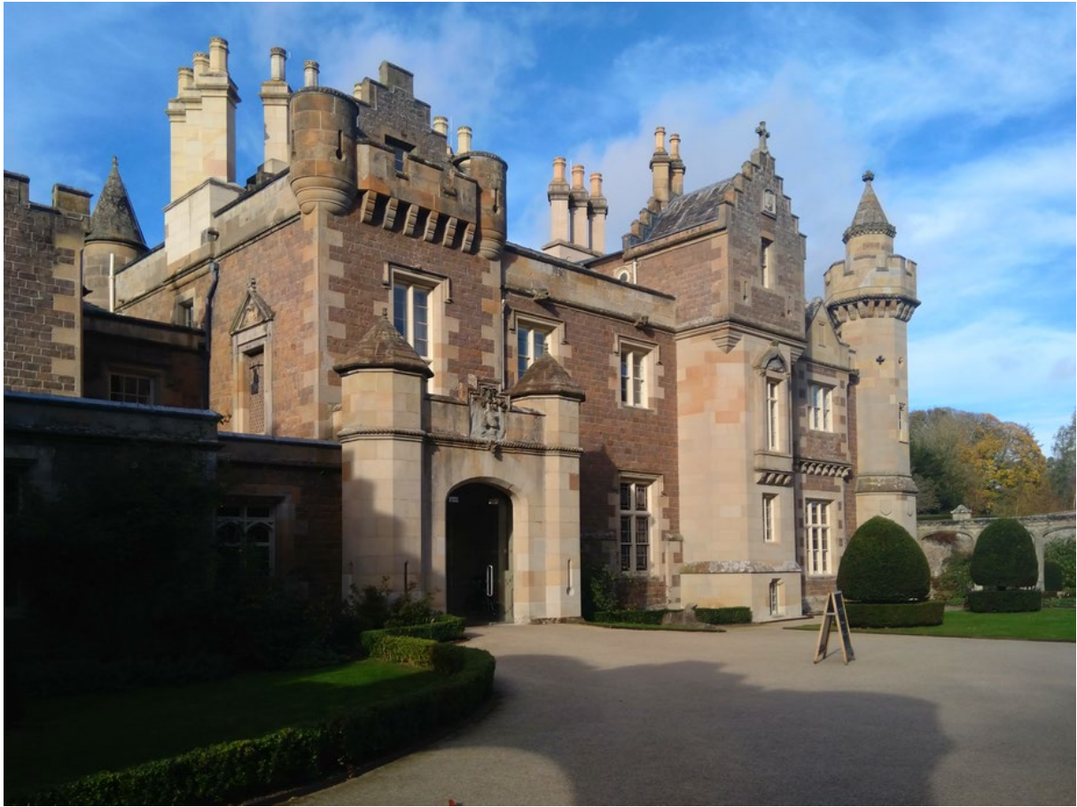
Fig. 1 - Abbotsford House vista da sud-ovest. In alto a sinistra è possibile scorgere la porta dell'Old Tolbooth, sormontata dal frontone proveniente dalla Parliament House.