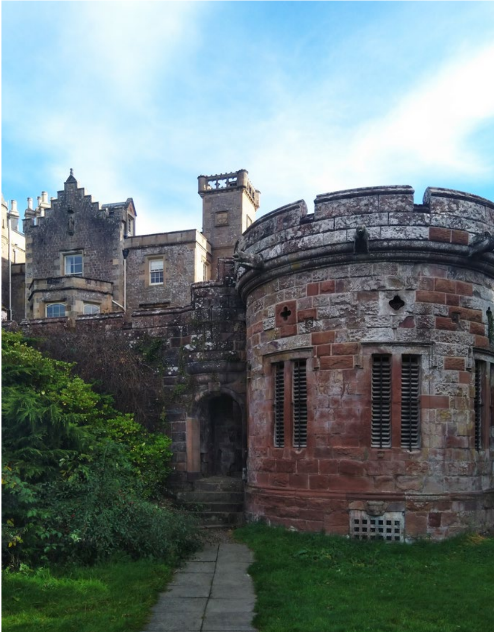
Fig. 2 - Abbotsford House vista da nord-ovest. In primo piano la ghiacciaia, dove sono evidenti i reimpieghi di spolia, come la scultura che spezza l'architrave della finestra in basso a destra (Eleonora A. Veneziano, 2018).