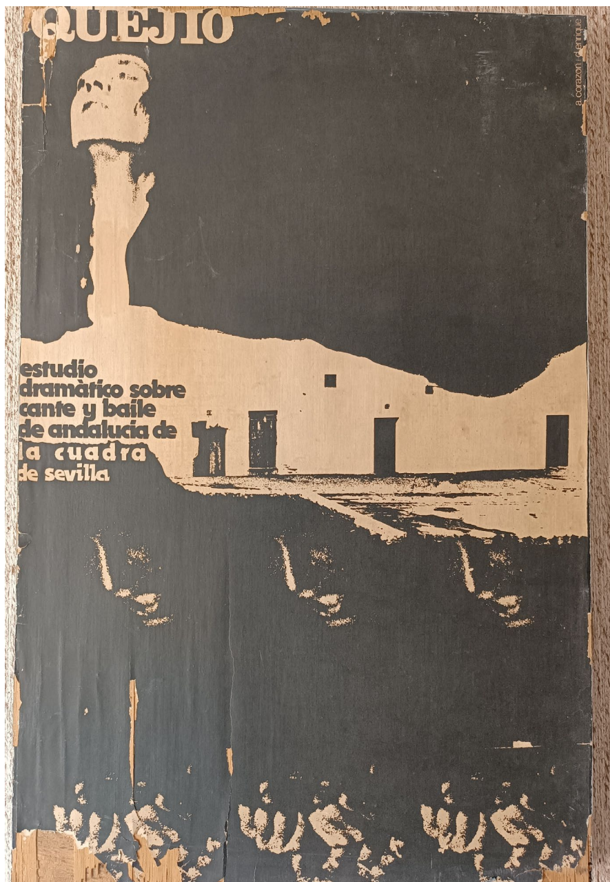
Fig. 5: Manifesto di Quejío , spettacolo de La Cuadra, Archivio privato di Lilyane Drillon.