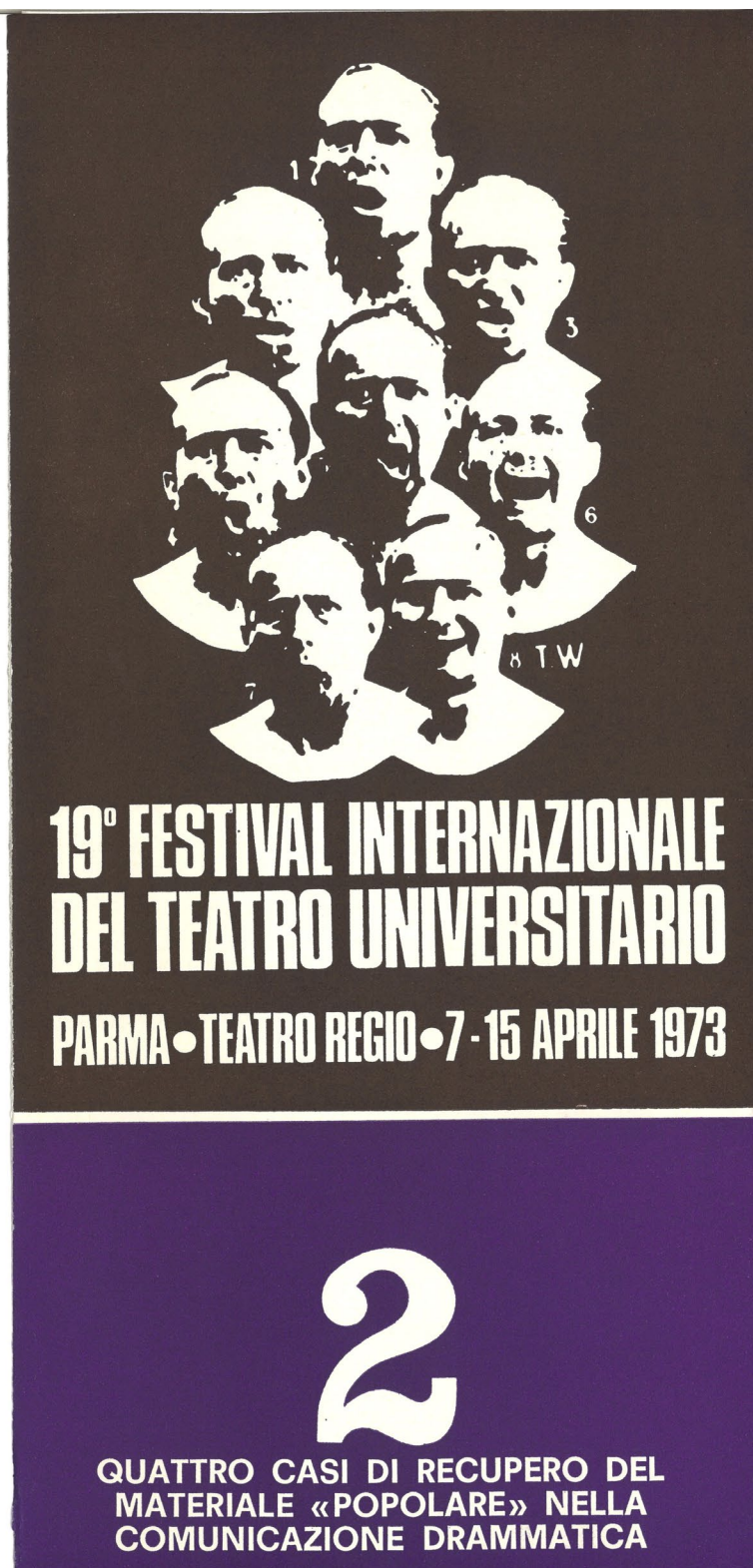
Fig. 1: Pieghevole del XIX FITU (1973), Archivio storico dell'Università di Parma.