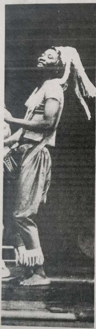
Gli afro-parigini del festival