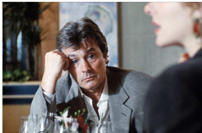
16. J.-L. Godard, Nouvelle vague (1990).