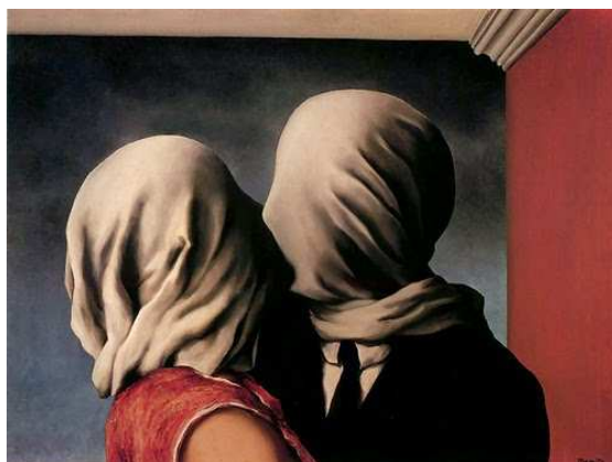
2. R. Magritte, Les Amants (1928).