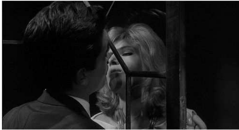
3. M. Antonioni, L'Eclisse (1962).