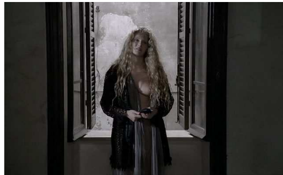
9. A. Tarkovskij, Nostalghia (1983).