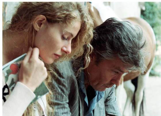
5. J.-L. Godard, Nouvelle Vague (1990).

Ed è significativo che anche in Nouvelle Vague il confronto fra i due personaggi si concluda con la morte dell'uomo, capovolgendosi però con echi quasi cristologici in una rinascita sotto altra identità: come se l'attimo di esitazione di Pierrot, che sembrava pentirsi del suicidio quando ormai era troppo tardi, si trasformi qui in una salvezza realizzata in extremis . Nella seconda scena sul lago di Nouvelle Vague , quando è scongiurata all'ultimo istante la morte della donna, il soccorso di Richard richiama il