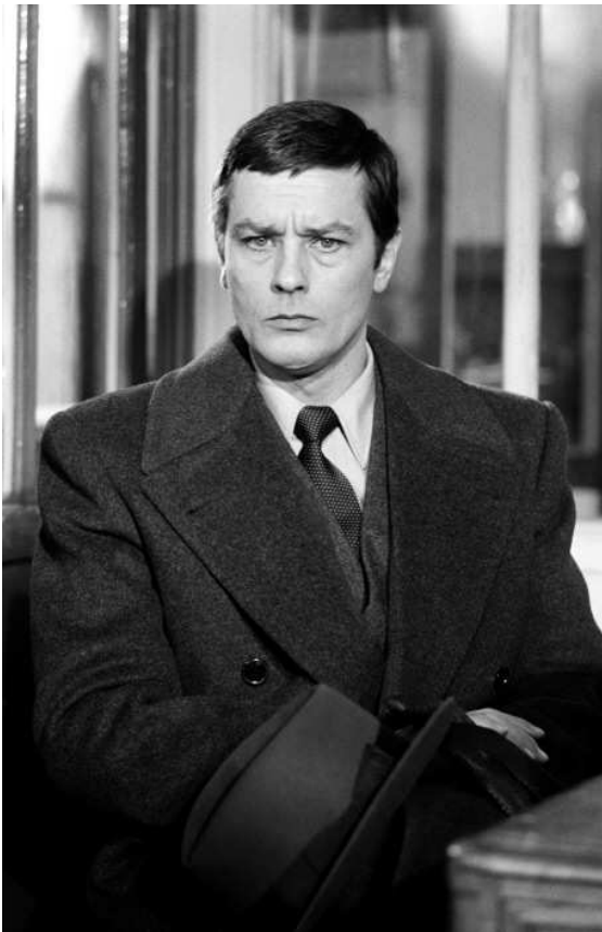
10. J. Losey, Mr. Klein (1976).