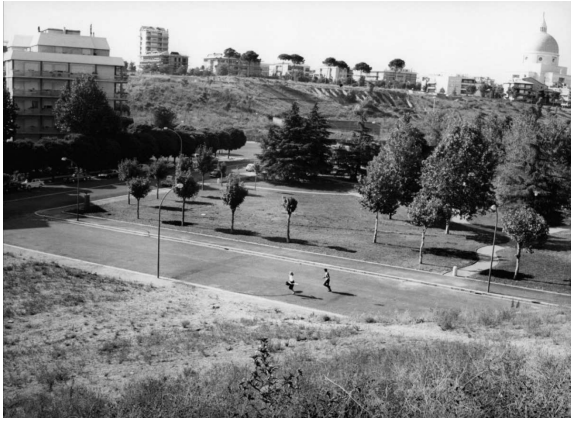
13. M. Antonioni, L'Eclisse (1962).