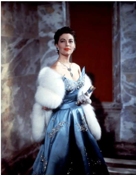
8. J. L. Mankiewicz, The Barefoot Contessa (1954).

Domiziana Giordano, con la sua avvenenza statuaria di stampo botticelliano, è la giovane italiana che Andrej Tarkovskij aveva scelto per Nostalghia (1983) e in Godard ricompare evocando, ancora, una figura rinascimentale e insieme la malinconica nostalgia dell'opera tarkovskiana. Ed è proprio la cangiante fisicità dell'attrice, dura e aggressiva quando trascina l'uomo alla morte nella prima parte, dolce e arrendevole quando a sua volta si lascia attirare verso l'acqua nella seconda parte, a sottolineare l'ambiguità costitutiva del film.