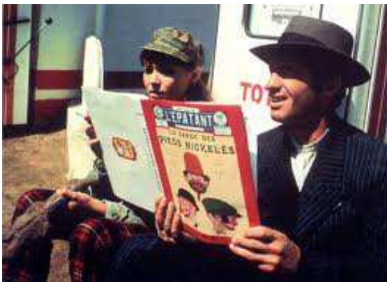
4. J.-L. Godard, Pierrot le fou (1965).

rifugiarsi con l'ambigua Marianne (Anna Karina) in un paesaggio edenico, riscoprendo come un novello Robinson la bellezza della natura e della contemplazione: trascinato poi dalla ragazza in un labirinto di menzogne e di pericolosi inganni, la ritrova infine su un'isola e la uccide, prima di concludere con un suicidio spettacolare. Nouvelle Vague ci ripresenta allora un Ferdinand non più giovane che si riunisce alla moglie perduta, l'italiana e ricchissima Elena Torlato-Favrini: l'antico ribelle torna sotto la protezione di quei privilegi che aveva abbandonato negli anni Sessanta, poiché non è più tempo di utopie rivoluzionarie e l' enfant terrible , invecchiato, accetta con stanchezza e rassegnazione la sconfitta (non senza rinfacciare alla padrona di casa il proprio benessere, forse per salvarsi la coscienza).