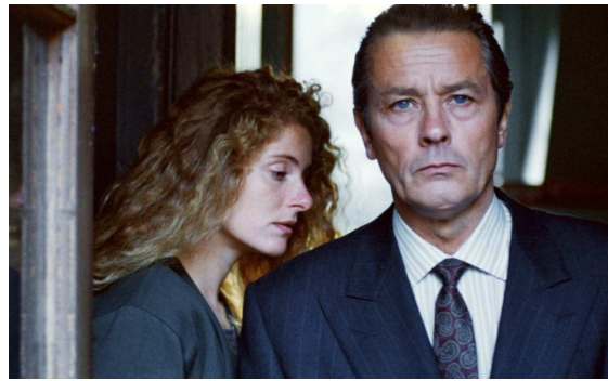
11. J.-L. Godard, Nouvelle Vague (1990).