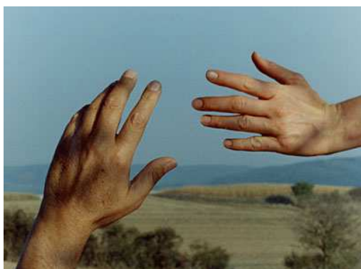
6. J.-L. Godard, Nouvelle Vague (1990).

gesto salvifico con cui Elena aveva aiutato Roger dopo averlo investito, durante il primo incontro: immagine di mani maschili e femminili che si stringono in un patto di unione e creazione (dagli echi michelangioteschi), mostrato da Godard con tempo volutamente rallentato la prima volta e in modo rapido e fuggevole la seconda.