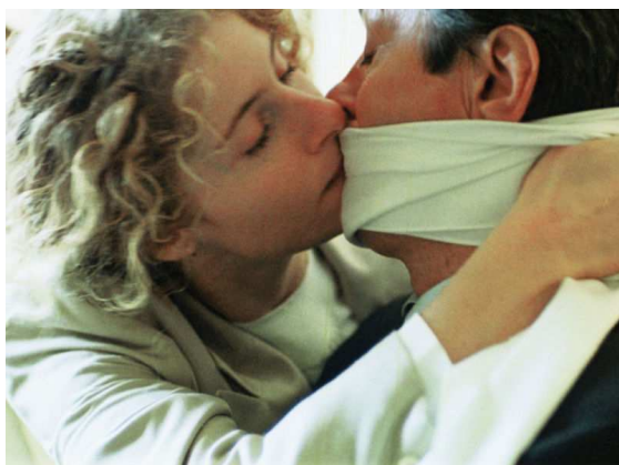
1. J.-L. Godard, Nouvelle Vague (1990).

Nel film godardiano, infine, spiccano dei veri e propri tableaux vivants che si qualificano come citazioni: Elena che si china ai piedi di Roger, come Maria Maddalena nel Vangelo di Giovanni; o la governante che spegne una dopo l'altra le lampade al primo piano, con un tessuto luministico memore del famoso Souffleur à la lampe di Georges de La Tour (mentre echeggiano le note di Verklärte Nacht ); o ancora Elena che avvolge le labbra di Lennox con una sciarpa baciandolo attraverso il tessuto, come nel dipinto Les Amants di René Magritte o in un'inquadratura dell' Eclisse (1962) di Michelangelo Antonioni.