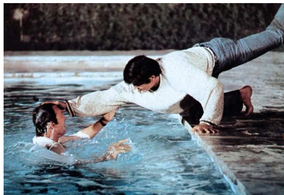
19. J. Deray, La piscine (1968).