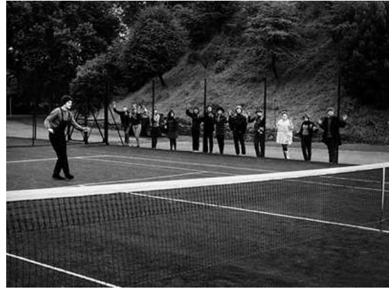
14. M. Antonioni, Blow-up (1966).

La controfigura depressa di Roger cela invece un riferimento a Robert Avranche, il garagista ubriacone e deluso dall'amore che Delon interpretava nel film di Bertrand Blier Notre histoire (1984): una pellicola che aveva modificato radicalmente l'immagine divistica dell'attore e che lo stesso Godard aveva citato in Histoire(s) du cinéma .