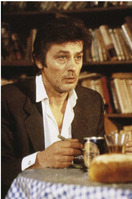
15. B. Blier, Notre histoire (1984).

La controfigura depressa di Roger cela invece un riferimento a Robert Avranche, il garagista ubriacone e deluso dall'amore che Delon interpretava nel film di Bertrand Blier Notre histoire (1984): una pellicola che aveva modificato radicalmente l'immagine divistica dell'attore e che lo stesso Godard aveva citato in Histoire(s) du cinéma .