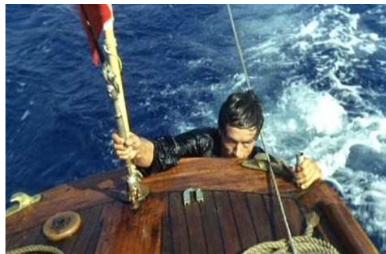
18. R. Clément, Plein soleil (1960).