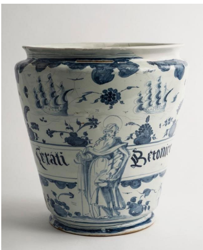
Fig. 3: Vaso da unguenti, maiolica decorata a tappezzeria, 1666, (h. 26 cm; diametro orlo 26 cm, piede 15 cm) Collezione Farmacia San Paolo, proprietà Comune di Savona in comodato al Museo della Ceramica.

Tutti i vasi sono in maiolica, caratterizzati da una decorazione “orientalizzante a tappezzeria” in blu su fondo bianco. Il corpo è interrotto al centro dal cartiglio recante la tipologia del contenuto, scritto in caratteri gotici con abbreviazioni, mentre, sul lato anteriore, al centro, campeggia la figura di San Paolo con i riferimenti iconografici che lo identificano: nella mano sinistra regge il libro delle Epistolae ad romanos e con la destra impugna la spada con la punta rivolta verso il basso [Fig. 3].