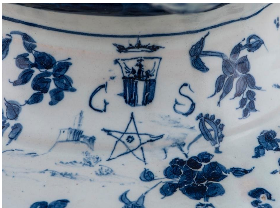
Fig. 4: Dettaglio stagnone, maiolica decorata a tappezzeria, 1666, Collezione Farmacia San Paolo, proprietà Comune di Savona in comodato al Museo della Ceramica.

Gli esemplari sono contrassegnati dalla marca “Stemma di Savona” che all’epoca, fino al primo decennio del Settecento, era utilizzato da diverse manifatture savonesi, identificabili solo in presenza delle relative marche. Unica fabbrica identificabile su due stagnoni è la fabbrica Salamone, riconoscibile per la presenza della stella a cinque punte e della sigla GS [Fig. 4]. Questi ultimi si distinguono dal resto della forniture anche per la qualità e accuratezza della decorazione, caratterizzata da uno sfondo fittamente animato da nuvolette, uccelli, insetti, castelli e angioletti, e l’intensità della colorazione blu 8 .