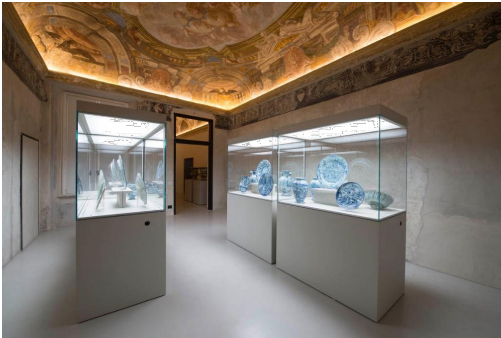
Fig. 1: Sala del Barocco, Museo della Ceramica di Savona.