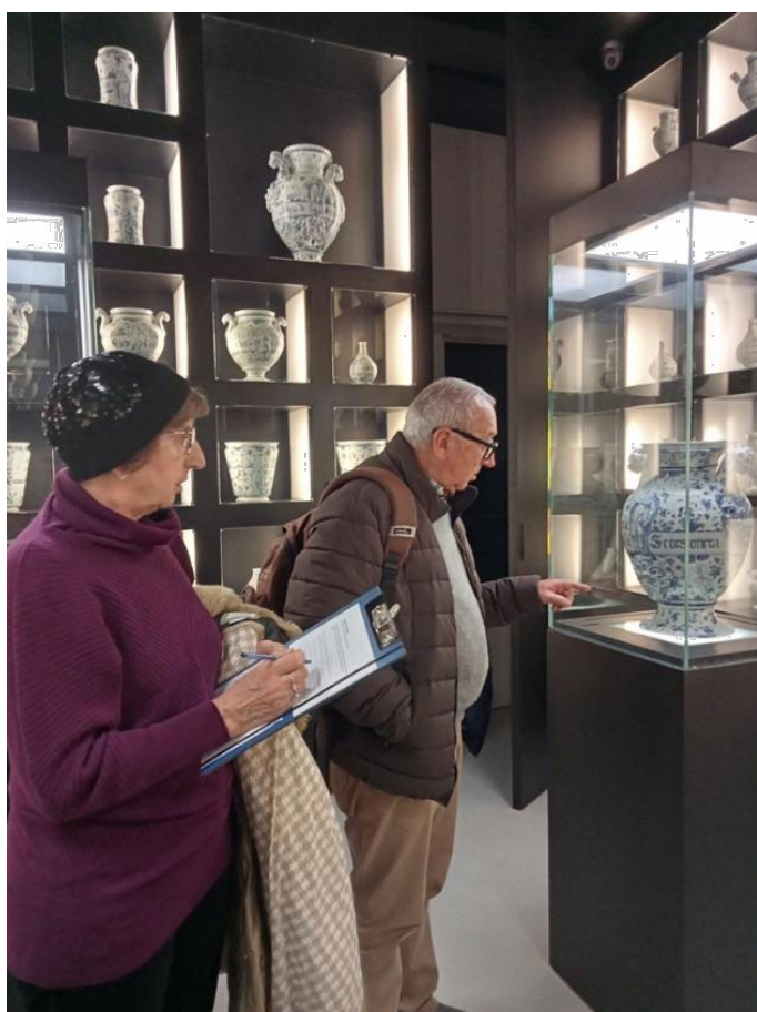
Fig. 7: Attività con il pubblico Ampliamo le conoscenze! Stimola la ricerca e il racconto del museo con le tue curiosità , Museo della Ceramica di Savona, 2022.

Attraverso alcune domande guidate, il pubblico viene invitato a condividere prima con un solo interlocutore per favorire lo scambio di idee e suggestioni e poi con l'intero gruppo quali elementi o aspetti hanno attratto maggiormente la sua attenzione e quali siano le curiosità emerse che non trovano adeguata risposta all'interno dei pannelli di sala [Fig. 7]. Poco sorprendentemente le domande che rispondono al claim Ampliamo le conoscenze! Stimola la ricerca e il racconto del museo con le tue curiosità travalicano i confini e le competenze di una sola disciplina, quella storico-artistica, e toccano temi trasversali e contestuali che più efficacemente possono trovare risposta negli studi di settori più o meno affini.