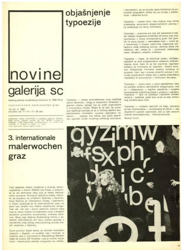
Fig. 5: Paolo Scheggi, Oplà Stick , Galerija Studentskog Centra, Zagabria, 6 maggio 1969.

Più recentemente una selezione di immagini fotografiche è visibile sul sito del Museo di Arte Contemporanea di Zagabria .