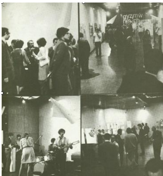
Fig. 4: Vedute della mostra Typoezija-Typoetry , 6-24 maggio 1969. Fotografie di Vladimir Jakolić (Koščević 1975).

Da altre fotografie risulta che la scenografia dello spettacolo di Scheggi, formata da un tabellone nero punteggiato da lettere tipografiche bianche, era sulla parete di fondo della sala principale, rettangolare e molto allungata, della Galleria del Centro Studentesco, come dimostrano altri scatti sempre firmati da Jakolić che ritraggono anche il pubblico che affollava la galleria (Koščević 1975, pp. 97-98).