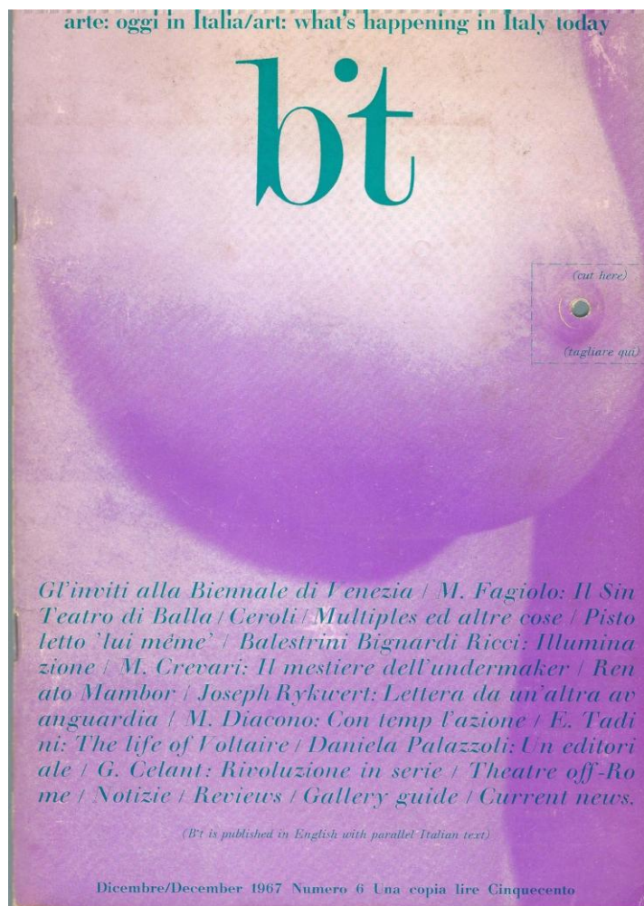
Fig. 8: Copertina di B't. Arte oggi in Italia , n. 6, dicembre 1967, ED912, Milano 1967.