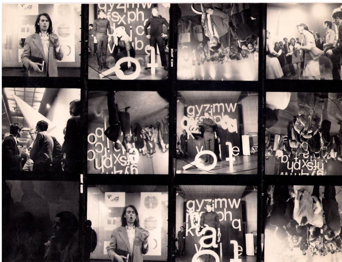
Fig. 1: Provino fotografico della mostra Typoezija-Typoetry , maggio 1969.

anche istituzionali, come bene dimostrano, per restare in terra croata, Tendencije 5 nel 1973 e più in generale le esposizioni ospitate dalla Galleria d'Arte Contemporanea di Zagabria a partire dal 1970 ( Typoezija-Typoetry 1970 ) [Fig. 1].