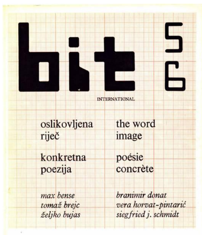
Fig. 6: Copertina di Bit International, n. 5-6, 1969.