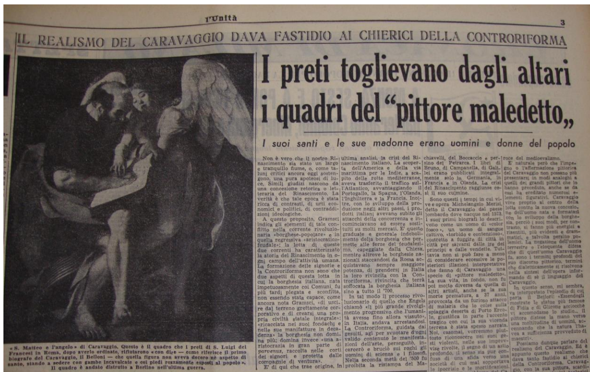
Fig. 3: Articolo di Mario De Micheli su L'Unità , 5 maggio 1951.