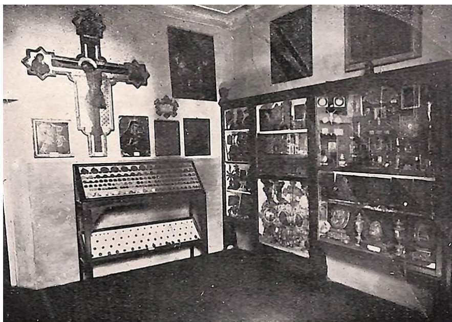
Fig. 2 - Foto della Sala n° 2 dedicata a San Francesco, Rimini, Museo dell'Osservanza, foto Montanari, tratta dal volume Il Santuario della Madonna delle Grazie sul colle di Covignano (Rimini), cenni storici e preghiere di padre Gregorio Giovanardi , Officina grafica Freshing, Parma, 1940.

Il percorso storico di questo frammento non segue le consuete tappe indicate dalla critica e compare per la prima volta nel 1937 in occasione della donazione del Cavalier Luigi Bolognini. Subisce un primo intervento di restauro e la sua prima musealizzazione nella sala n.2 (Sala San Francesco), distinta dalle aree espositive dedicate alle ceramiche dove è consuetudine allestire opere di questo tipo all'inizio del Novecento 4 . Nella sala in questione si trovano diverse opere di rilievo, ma di natura diversa, tra cui un Crocifisso di scuola giottesca riminese, sculture in terracotta della scuola bolognese, un autoritratto seicentesco attribuito a Guido Reni, quadro di Ecce homo del Soleri e un quadro riferito al Correggio; mentre l'opera trattata viene descritta come «Testa di S. Francesco d'Assisi in estasi, suggestiva plastica di Guido Mazzoni da Modena, del '500, che si fa guardare a lungo» (Giovanardi 1940, p. 52) [Fig. 2]. Nel novembre 1969, risulta registrata nell'inventario generale 5 delle opere d'arte conservate nel museo, con indicazione della sua provenienza dal Convento di Santa Maria degli Angeli a Busseto. Nel 2000 viene effettuato un ultimo spostamento da Covignano al Museo dell'Osserva di Bologna 6 dove tutt'oggi risiede, anche se la struttura che lo ospita, giudicata inagibile, non permette la visione da parte del pubblico.