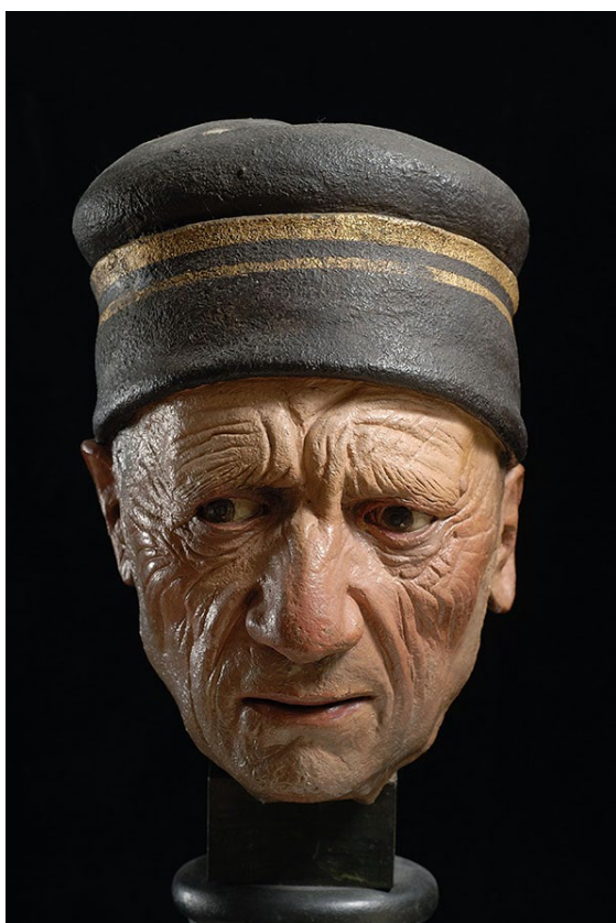
Fig. 4 - Guido Mazzoni, Testa di vecchio , terracotta policroma, Modena, Galleria Estense.

profondamente malinconica e sofferente del volto, sono infatti tratti incompatibili in una Natività , ma coerenti con quelli di un Mortorio . Adalgisa Lugli si spinge fino a riconoscere un probabile Nicodemo (Lugli 1990, pp. 322-323). Il frammento è acquistato in data non precisata dal collezionista e critico Pietro Vitali, il primo ad attribuire il Compianto di Busseto a Guido Mazzoni, precedentemente reputato opera di Antonio Begarelli. Pietro Vitali non accenna a questa scultura nei suoi scritti, il che fa dedurre sia entrato nella sua personale collezione solo alla fine della sua vita o comunque successivamente alla pubblicazione del suo volume dedicato a Busseto (Vitali 1819).