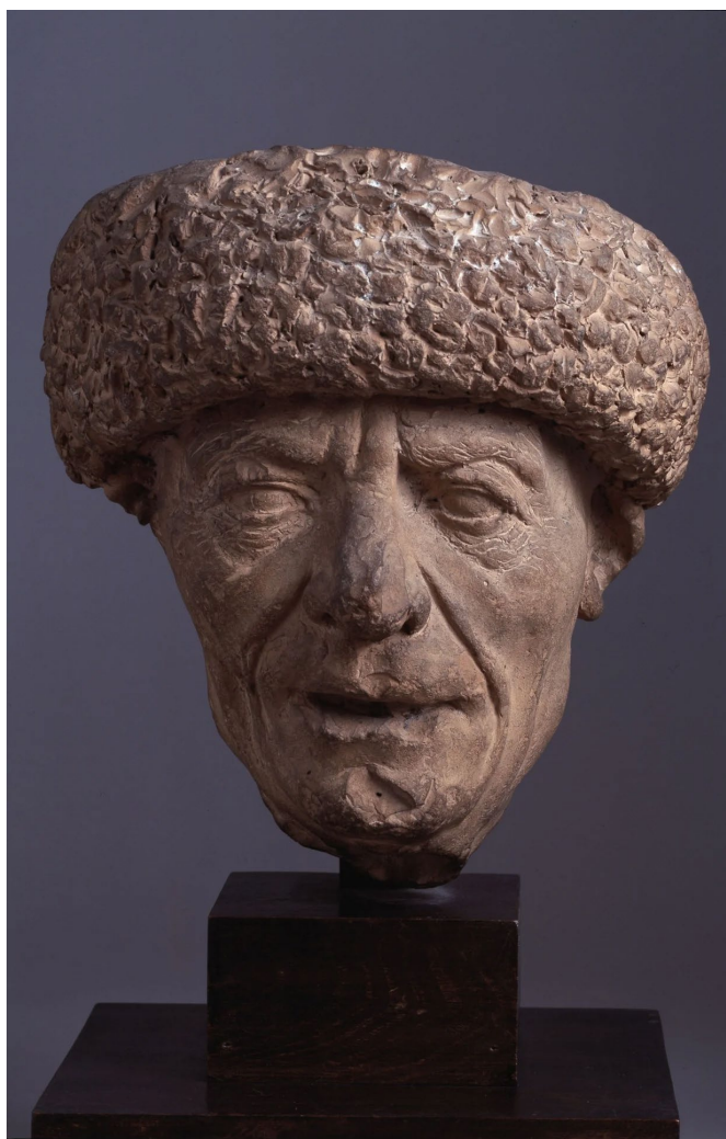
Fig. 3 - Guido Mazzoni (attribuito), Testa di uomo , terracotta, Ghent, Museum of Fine Arts Ghent

Analogamente un secondo frammento compare all'inizio del XX secolo. Si tratta di Testa di uomo [Fig. 3], un frammento in terracotta, senza tracce di policromia, trattato dalla critica moderna unicamente da Adalgisa Lugli nel 1990 (Lugli 1990, p. 336), la quale lo classifica come opera non attribuibile a Guido Mazzoni 7 .