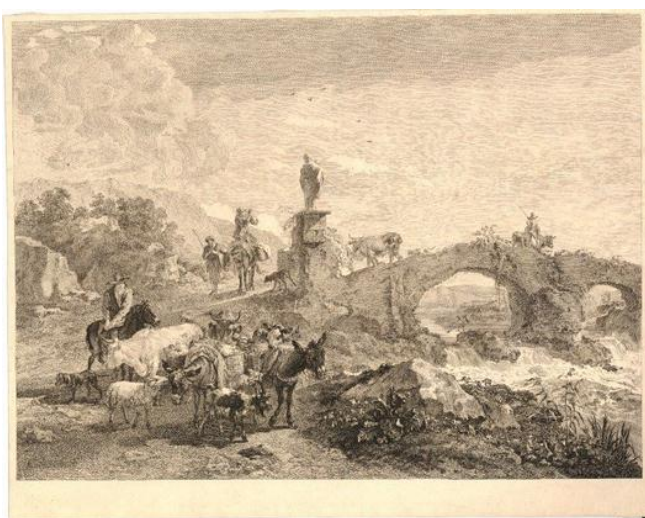
Fig. 18: J.-Ph. Le Bas da N. Berchem ( Paesaggio italiano con ponte , San Pietroburgo, Hermitage), 1741.

Si è poi già accennato al fatto che nel gennaio 1775 a Parigi l'incisore di corte Johann Georg Wille registra nel suo diario di aver commissionato a Palmieri l'esecuzione di due disegni à la manière de Guercino, artista ben noto a Palmieri fin