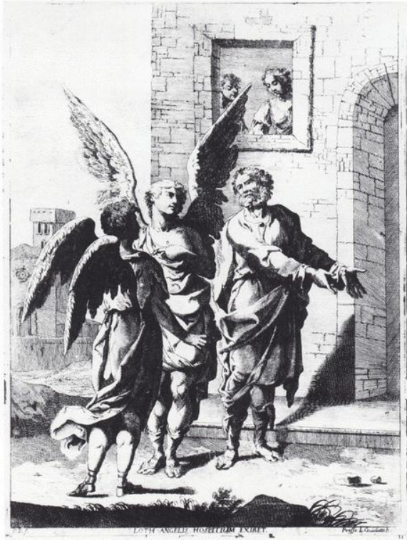
Fig. 1: P.G. Palmieri, Loth angelis hospitium exhibet , acquaforte, 305 x 220 mm.