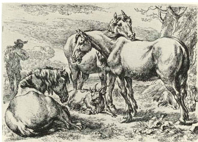
Fig. 16 (sotto): N. Berchem, acquaforte, 119 x 171.

Una operazione analoga viene svolta dal bolognese nei quattro disegni di Palazzo Madama datati 1793 (nn. inv. 2625-2628/DS), un vero e proprio collage di figure e animali tratti da incisioni di Londonio - in particolare dalla serie dedicata al Cardinal Pozzobonelli; ancora una volta Palmieri ricomponne le sue fonti in un nuovo insieme, in questo caso sullo sfondo di paesaggi resi con un acquerello molto pesante, adottato anche nei già citati fogli della Reale, che andranno quindi datati intorno agli stessi anni (uno dei fogli è pubblicato in Bertone 2009, p. XIX; per le incisioni di Londonio si veda Scola 1994).