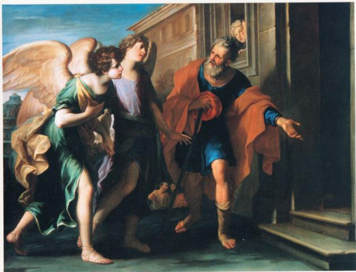
Fig. 2: M. Franceschini, Loth e gli angeli , olio su tela, 149 x 194 cm, Credito Emiliano (immagine tratta da ed. Bonvicini 2010, pp. 160-161).