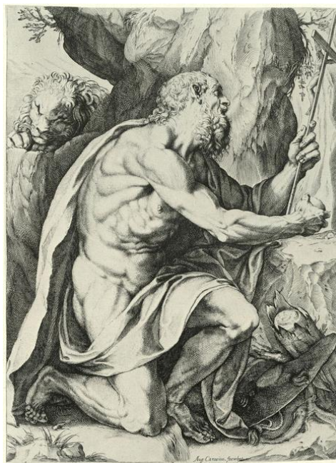
Fig. 12: Agostino Carracci, San Gerolamo , bulino, 384 x 276 mm.