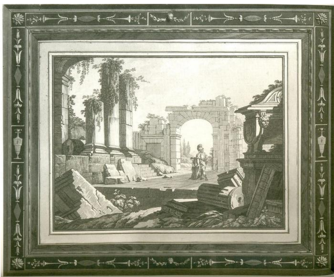
Fig. 3: G.M. Bonzanigo (cornice), P.G. Palmieri, penna e acquerello su carta, 360 x 470 mm, collezione privata.

Amedeo III in occasione del matrimonio del suo secondogenito Vittorio Emanuele, poi duca d'Aosta, con Maria Teresa d'Asburgo-Este nel 1789 e destinati ad adornare il gabinetto di lavoro del duca nel castello di Moncalieri (ed. Bertolotto, Villani 1989, pp. 131-132; Dalmaso, Bertolotto 1991-92) [fig. 3]. I disegni sono realizzati a penna e acquerello con un tratto che imita quello incisivo, come se si trattasse di fac-simile di stampe, ma è chiaro che il loro utilizzo non è finalizzato alla riproduzione incisa: al contrario essi vengono incorniciati ed esposti e il loro valore è dato soprattutto dal gusto per lo scambio delle tecniche, volto al gioco e al disorientamento dello spettatore.