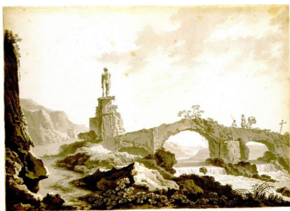
Fig. 17: P.G. Palmieri, Vecchio ponte diroccato, rovina con statua di Ercole , 370 x 543 mm, Torino, GAM, n. inv. fl/2198 (immagine tratta da Natale 2009, n. 6).

varianti una stampa di Jan Visscher da un'invenzione di Nicolaes Berchem (Widauer 1997, pp. 120-121, n. 48). In questo caso il modello compositivo e iconografico ripreso nel suo complesso viene attualizzato sotto l'aspetto stilistico: Palmieri infatti semplifica la composizione attraverso la modificazione dei rapporti luce-ombra, e la rende più ariosa eliminando gli alberi che nella stampa seicentesca vanno a fare da sfondo alla scena. Allontana ulteriormente la linea dell'orizzonte ponendo sul piano di fondo una cima montuosa che va sfumando nel cielo luminoso; l'ariosità è accentuata da un uso fluido dell'acquerello e della linea di contorno. Palmieri realizza la stessa operazione nel paesaggio databile agli anni novanta conservato presso la GAM di Torino, nel quale il modello di Berchem - trasmesso tramite l'incisione di Le Bas, Le matin - è attualizzato in chiave neoclassica: la composizione è semplificata e strutturata su direttrici geometriche più chiare rispetto al modello, i contrasti luce e ombra sono resi con acquerellature a macchie, la statua barocca è sostituita da una scultura classica [figg. 17, 18].