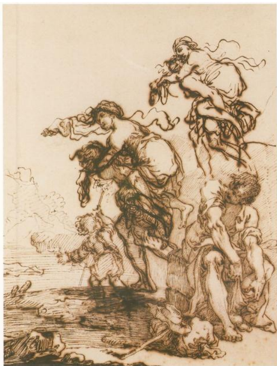
Fig. 4: P.G. Palmieri, Studi di varie figure , 1773, Gesso nero, penna e inchiostro ferrogallico bruno, acquerello bruno, 442 x 333 mm, Christie's Paris, Dessins Anciens du 18ème et du 19ème Siècle , 17 marzo 2005, lotto 310.

all'altro dà la misura di come Palmieri mirasse a giungere da uno schizzo condotto con un tratto assai libero, a una forma finale che imita le stampe nella rigidità del segno e rimanda nei dettagli iconografici a modelli olandesi [figg. 4, 5].