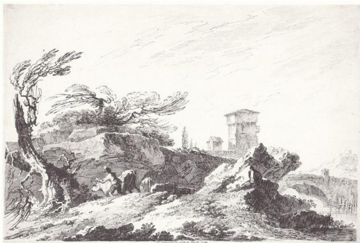
Fig. 20: P.G. Palmieri, Paesaggio con pastore , 1774, Penna e inchiostro nero, 240 x 360 mm, Sotheby's New York, Old Master Drawings , 16 gennaio 1986, lotto 81.

des Arts graphiques del Louvre, nn. Inv. 9540 recto , 9541 recto , 9542 recto , 9544 recto ).