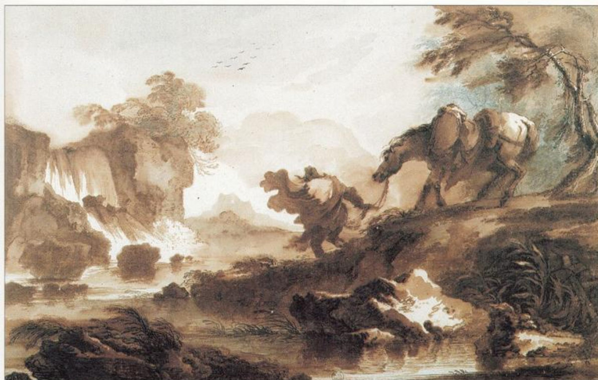
Fig. 6: P.G. Palmieri, Paesaggio con cascata , Penna e inchiostro bruno, acquarello bruno e grigio, 375 x 580 mm, Montpellier, Musée Atger, n. inv. 218 (immagine tratta da Vallès-Bled 2008, n. 82).

Baptiste Le Prince, che ha sviluppato, a partire dal 1768, la maniere de lavis - a spingere Palmieri a realizzare acquerelli dall'aspetto estremamente pittorico (Natale, in ed. Bertone 2009, pp. 3-9): ne costituiscono un buon esempio due paesaggi conservati al Musée Atger di Montpellier (Loisel, in Maïthé Vallès-Bled 2008, nn. 82-83) [fig. 6].