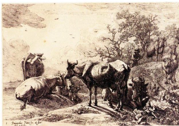
Fig. 14 (sotto): P. Potter da N. Berchem, acquaforte, 180 x 265 mm.