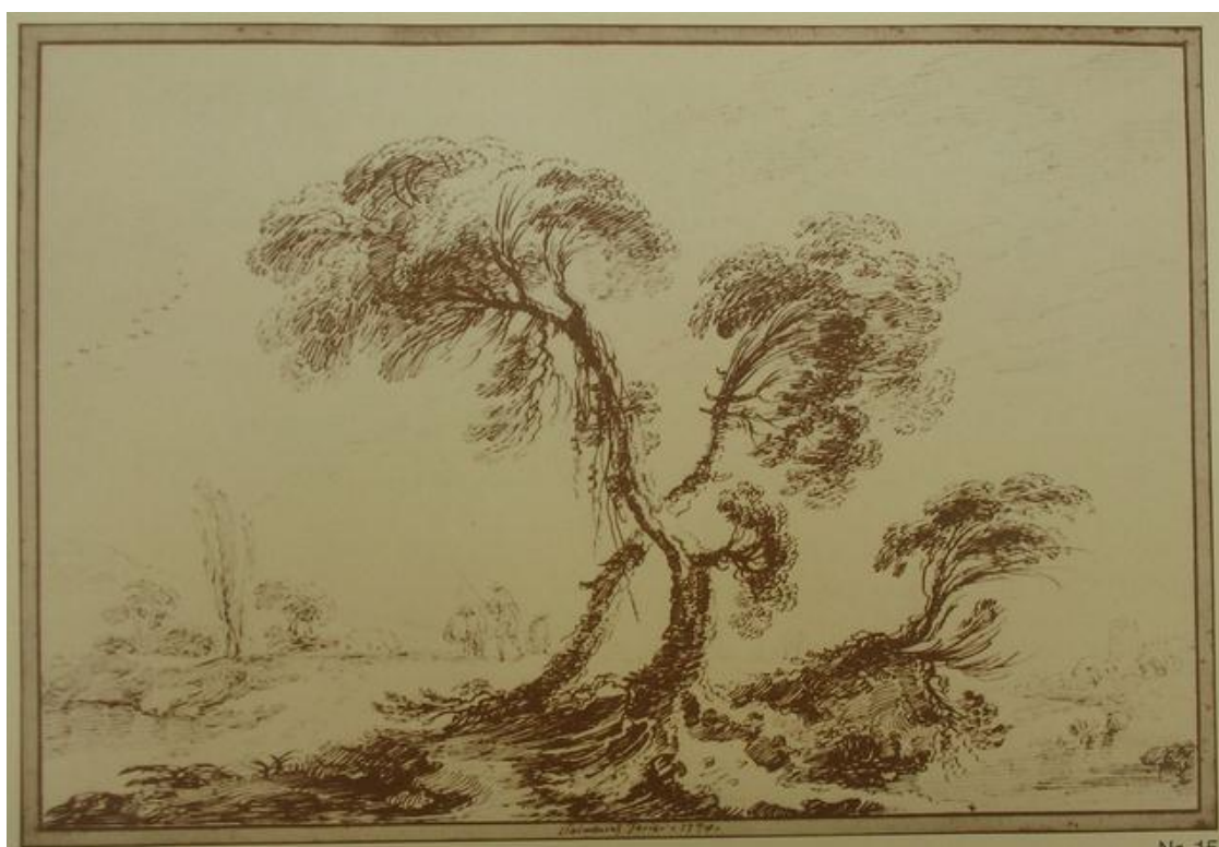
Fig. 19: P.G. Palmieri, Paesaggio , 1774, penna e inchiostro marrone, 157 x 233 mm, Galerie Gabor Kékkö, Luzern, Meisterzeichnungen VI , 1975.

dagli anni sessanta - come dimostra uno dei già menzionati trompe-l'oeil di New York - e proprio agli anni settanta è riferibile, sulla base di alcuni disegni datati, un nutrito gruppo di fogli dell'artista che guardano all'artista di Cento. Tra quelli firmati, un buon numero rimanda direttamente a modelli diffusi dal Guercino o dai suoi incisori e imitatori, sebbene Palmieri faccia uso di un tratto più libero e morbido, meno inciso rispetto a quelli del Barbieri [fig. 19] (si vedano anche un disegno ora al Museum of Fine Arts di Boston, n. inv. 2011.108 , e uno del Département des Arts graphiques del Louvre, n. inv. 9545 recto ).