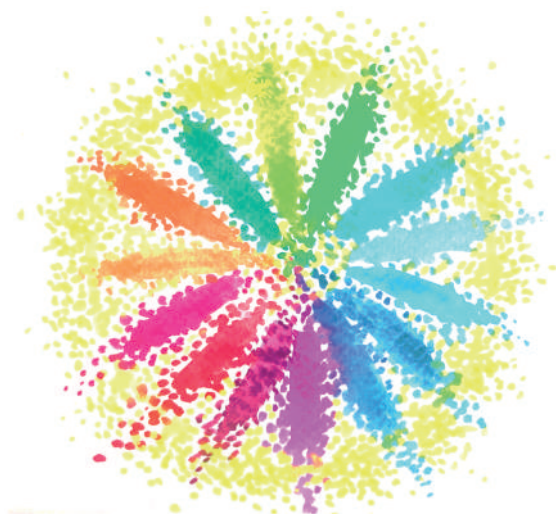
Fig. 2 - L'interesse generale come cerchio esterno, dove i molti e variegati soggetti attivi nella cura dei beni comuni dimostrano "interesse al disinteresse"

Costituzione italiana, in ricerche ormai antiche, e nei patti con i cittadini; (iii) che la proposta di un settore pubblico che faciliti l'empowerment e l'autonomia iniziativa non deve essere vista come sostitutiva dei servizi pubblici, che consideriamo standard novecenteschi che vanno sia assicurati e difesi che ibridati e innovati. Quando i servizi standard si intrecciano ai servizi ibridi e condivisi, in accezione sussidiaria, ecco un valore aggiunto comunitario che, per così dire, li aumenta (Ciaffi, 2024).