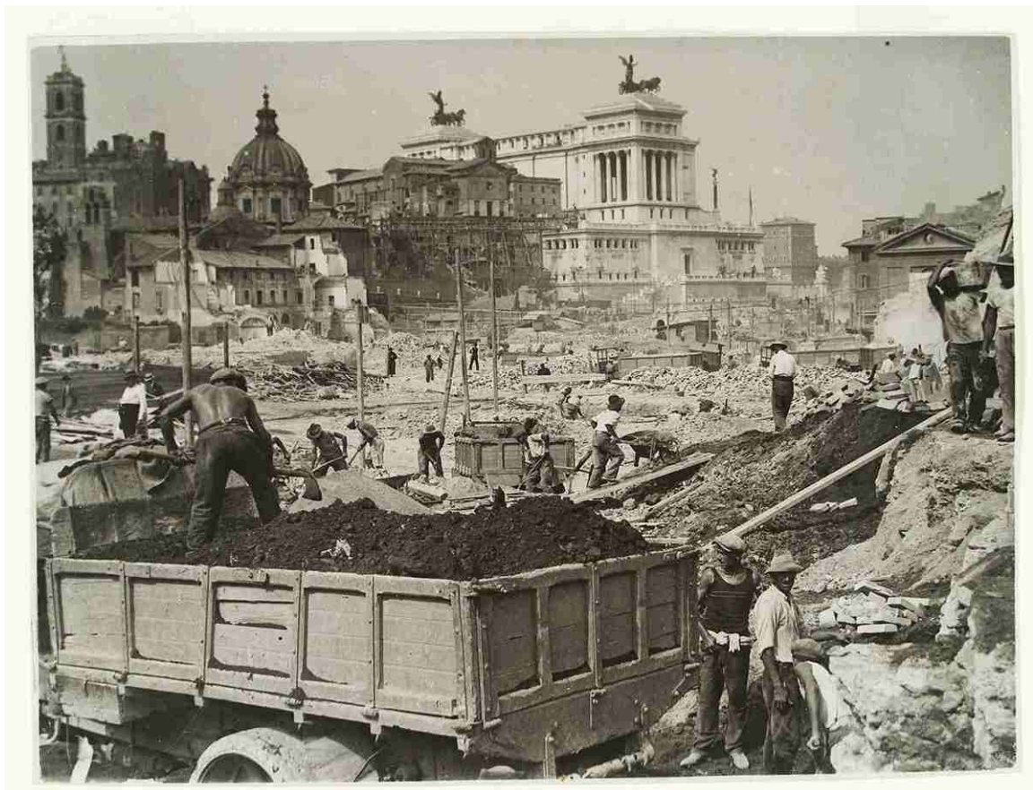
Fig. 5: Roma - Via dei Fori Imperiali in costruzione, 1932/09/23, positivo, BN, gelatina ai sali d'argento