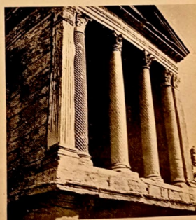
Fig. 2: Festival of Two Worlds 1958, pp. 5-6.