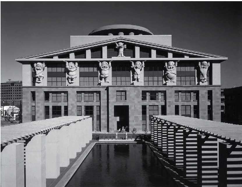
Fig. 3. Disney Co. Headquarters, Burbank