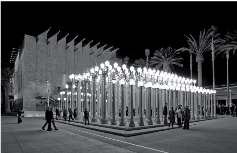
Fig. 7. Los Angeles County Museum of Art (LACMA)