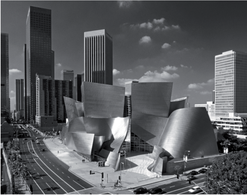
Fig. 6. Disney Concert Hall