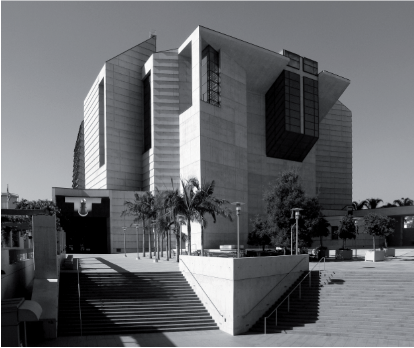
Fig. 4. Cattedrale di Nostra Signora degli Angeli