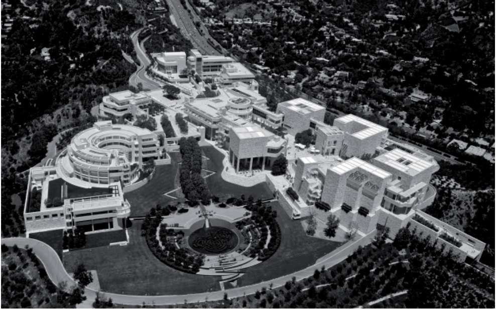
Fig. 8. Getty Center