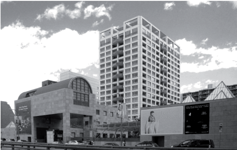
Fig. 5. Museum of Contemporary Art (MOCA)